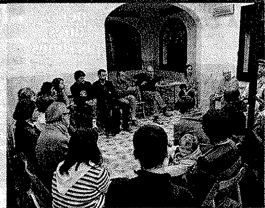
Una vintena d'entitats ja van fer dissabte una reunió a la Torre del Fanal

Una vintena d'entitats de la Garriga van tenir el primer contacte amb la Torre del Fanal, després de la primera reforma que hi ha fet l'Ajuntament per convertir-la en casal d'entitats. Ara ja es podrà fer servir de forma immediata, tot i que falta decidir el model de gestió.