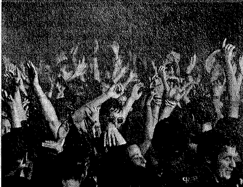
(Pàgines 24 i 25) Moments d'aigua a la festa de l'Escaldàrium de Caldes, aquest dissabte a la nit